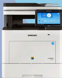
C4060FX (40 ppm)